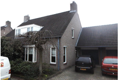
zuidoost- en noordoostgevel